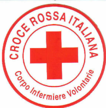
Fig. 5 (disposizione logo anteriore)